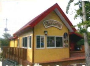
親子広場 0才~3才 三世代交流広場