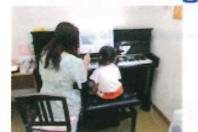
音楽教室 年少~一般