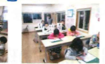
書道教室 年長~小学生