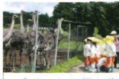
ダチョウ王国見学