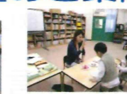
ECC英語倶楽部 年少~小学生