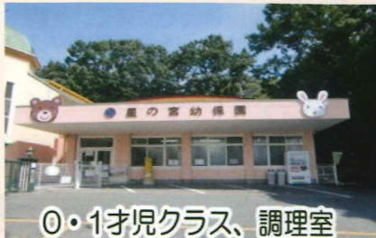
0・1才児クラス、調理室