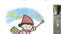
パレエ教室 年少~小学生