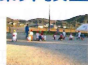
サッカークラブ ナイター設備有り 年少~小学生