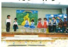
クリスマス発表会