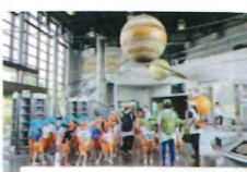
プラネタリウム見学