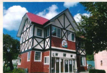
1F 一時預かり保育事業 (1~3才児)