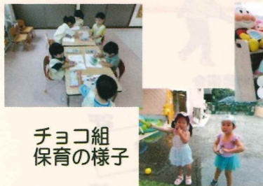
チョコ組 保育の様子