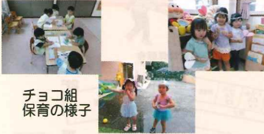
チョコ組 保育の様子