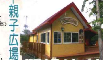
親子広場 0才~3才 三世代交流広場