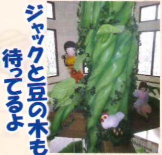
ジャックと豆の木 待ってるよ

月曜日~金曜日 通常保育日 土曜日 土曜希望保育日 1号認定 午前9時~午後3時 2号認定 午前7時~午後6時 3号認定 午前7時~午後6時 延長保育 午後6時~午後7時