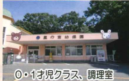
0・1才児クラス、調理室