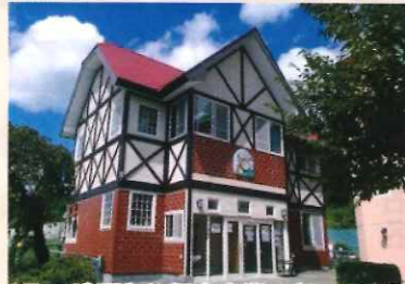
1F 一時預かり保育事業 (1~3才児)